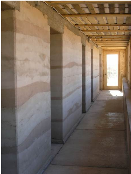
ภาพประกอบ 3 เทคนิคดินอัด

เทคนิคดินอัดเป็นที่นิยมในหลายภูมิภาคทั่วโลก แหล่งใหญ่ของการก่อสร้างประเภทนี้ ได้แก่ แอฟริกาเหนือ ออสเตรเลีย ภูมิภาคในอเมริกาเหนือและใต้ จีนและยุโรป โดยเฉพาะฝรั่งเศส เยอรมนี และสเปน นอกจากผนังดินอัด จะเป็นผนังรับน้ำหนักที่แสดงความสวยงามของสีดินแต่ละชั้นที่กระทัดลงในแม่แบบแล้ว ข้อเด่นอีกประการหนึ่งของผนังดินอัด คือ คุณสมบัติการเป็นมวลสารหน่วงความร้อน (Thermal Mass) 1 โดยพบว่าอาคารที่ก่อสร้างโดยใช้ ผนังดินอัดมีระดับอุณหภูมิภายในอาคารค่อนข้างคงที่ตลอดวัน สามารถใช้ได้กับทั้งภูมิอากาศเขตอบอุ่นและเขตร้อน ชื่น เช่น ประเทศไทย ช่วยสร้างสภาวะน่าสบาย (Thermal Comfort) ให้แก่ผู้อยู่อาศัย อย่างไรก็ตามแม้ผนังดินอัดจะมีข้อดีหลายประการดังที่กล่าวมา เทคนิคการก่อสร้างดังกล่าวยังไม่เป็นที่นิยม ในประเทศไทยเนื่องจากต้องมีการสร้างแม่แบบ (Formwork) หากเป็นแม่แบบไม้มักใช้รับการอัดกระทัดได้เพียงครั้ง เดียวแล้วต้องทิ้ง ซึ่งเป็นความสิ้นเปลือง แม่แบบเหล็กจึงมีความทนทานสามารถใช้ซ้ำได้มากกว่าแต่มีราคาแพง ในต่างประเทศมีการนำแม่แบบเหล็กที่ใช้กับการก่อสร้างคอนกรีตมาปรับใช้กับดิน (Dahman & Ochsendorf, 2005) แต่สำหรับ ประเทศไทยยังมีความวิจัยเรื่องผนังดินอัดและการพัฒนาแม่แบบเหล็กสำหรับการก่อสร้างดังกล่าวจำนวนจำกัด