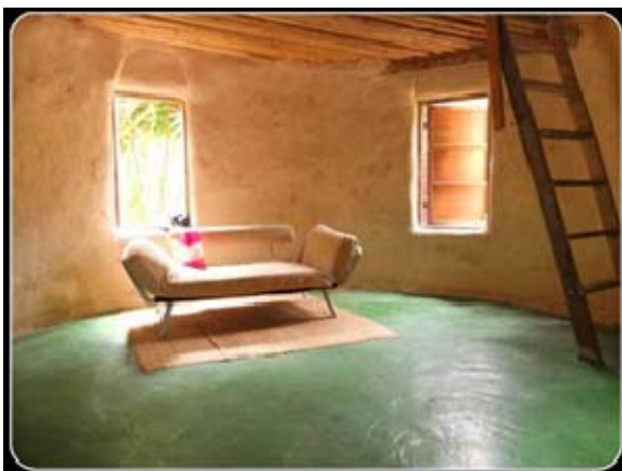
ภาพประกอบ 1 เทคนิคดินปั้น

สำหรับดินอัด (Rammed Earth) มีความคล้ายคลึงกับบล็อกประสานในการเป็นผนังรับน้ำหนักและมี ส่วนผสมของวัสดุเช่นเดียวกัน โดยประกอบด้วยดินที่มีความละเอียดระดับทราย (Sand) ซีเมนต์ และน้ำ แต่ บล็อก ประสานมีข้อจำกัดในเรื่องรูปแบบและขนาดของบล็อกเนื่องจากผลิตด้วยเครื่องอัด Cinva Ram ที่ให้แม่พิมพ์เพียง บล็อกสี่เหลี่ยมสำหรับก่อผนังและบล็อกโค้งที่ใช้กับการสร้างบ่อน้ำหรือกำแพงโค้งรัศมีจำกัดตามกำหนดของเครื่องอัด การ ก่อสร้างผนังดินอัดจึงให้อิสระกับการออกแบบสถาปัตยกรรมมากกว่า โดยรูปแบบของผนังขึ้นอยู่กับอาคารสร้าง แม่แบบ สำหรับการอัดกระทุ้งดิน (Takkanon & Yeung, 2008)