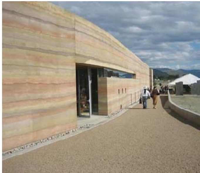
ภาพประกอบ 4 เทคนิคดินอัด