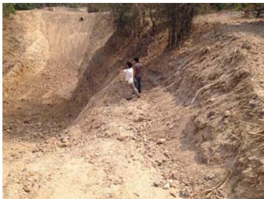
ภาพประกอบ 8 การเลือกดินในพื้นที่ใกล้กับที่ตั้งโครงการ

จากโครงการดังกล่าว สามารถเรียนรู้เทคนิคการก่อสร้างแบบดินอัด ได้ดังนี้ การเลือกดิน สำหรับการก่อสร้างแบบดินอัด ควรหาแหล่งดินจากพื้นที่ใกล้กับที่ตั้งโครงการ โดยไม่ใช้ หนาดินที่มีความอุดมสมบูรณ์ เลือกดินในพื้นที่ซึ่งอยู่ระหว่างการขุดบ่อเพื่อเก็บกักน้ำทางการเกษตร ความลึกประมาณ 8-10 เมตร ระยะทางห่างจากสถานที่ก่อสร้างประมาณ 10 กิโลเมตร ได้ดินที่มีองค์ประกอบที่เหมาะสม 2 โทณสี