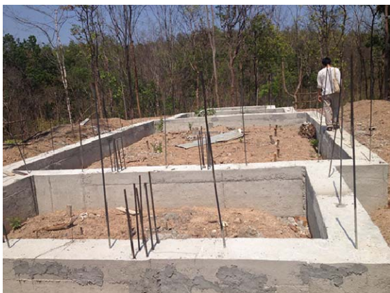
ภาพประกอบ 5 ฐานราก คสล. สำหรับรับน้ำหนักโครงสร้าง

การออกแบบผนังดินอัดต้องคำนึงถึงสัดส่วนความสูงและความหนาของผนัง และเนื่องจากเป็นผนังรับน้ำหนัก ผนังจึงมักมีความหนาไม่น้อยกว่า 20-30 เซนติเมตร การก่อสร้างต้องมีการเตรียมฐานรากเพื่อรับน้ำหนักของโครงสร้างด้วย ทั้งนี้กำลังอัดที่ต้องการต้องไม่น้อยกว่า 70 ksc และอัตราการซึมน้ำต้องไม่เกิน 15% โดยน้ำหนัก