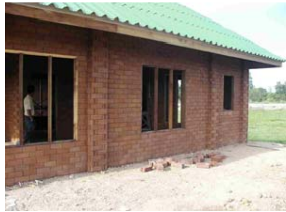
ภาพประกอบ 2 เทคนิคบล็อกดินอัด