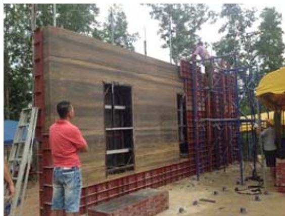
ภาพประกอบ 6 ผนังดินอุโบสถภาคเหนือ