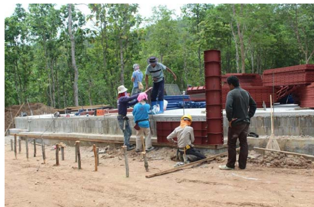
ภาพประกอบ 9 การเตรียมแม่แบบเหล็ก