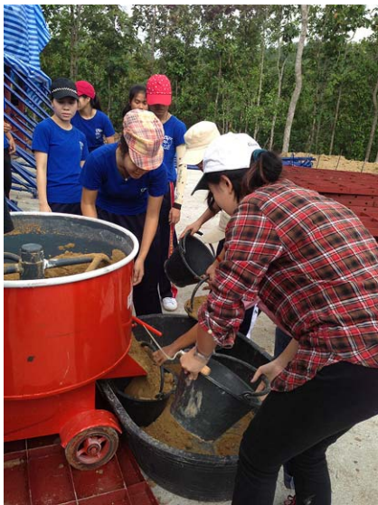
ภาพประกอบ 10 การเตรียมส่วนผสม

การเตรียมส่วนผสม นำดินมาร่อนเศษพืชและหินก้อนใหญ่ออกด้วยตะแกรงขนาดเส้นผ่าศูนย์กลาง 2 นิ้ว จากนั้นจึงผสมดินกับปูนซีเมนต์ขาวปอร์ตแลนด์ ในอัตราส่วน 10 : 1 (ประมาณ 9 %) พร้อมควบคุมความชื้น ประมาณ 10 % ขณะอัด