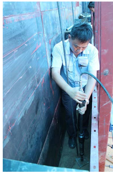
ภาพประกอบ 11 การอัดกระทุ้ง

การอัดกระทุ้ง เทส่วนผสมลงในแบบแล้วทำการอัดกระทุ้งทุกระยะความสูง 10 เซนติเมตร โดยบดอัด ด้วย เครื่อง Pneumatic Rammer ขับเคลื่อนด้วยปั๊มลมโรตารี ขนาด 90 แรงม้า พร้อมกัน 4 ชุด