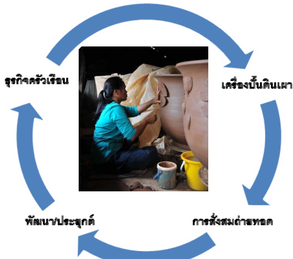
ภาพประกอบ 5 แสดงความสัมพันธ์ของภูมิปัญญาเครื่องปั้นดินเผาสู่การพัฒนาธุรกิจครัวเรือน ด้านเกวียน