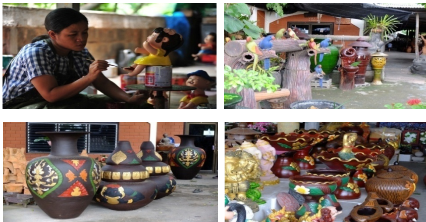
ภาพประกอบ 4 เครื่องปั้นดินเผาที่มีการตกแต่งลวดลายและสีสันทันเพื่อเน้นการประดับตกแต่ง

ด้านผลิตภัณฑ์ส่วนใหญ่ที่เป็นสินค้าหลักของด่านเกวียน ได้เปลี่ยนจากผลิตภัณฑ์ที่ปั้นเพื่อการใช้งานในชีวิตประจำวันที่ต้องการความแข็งแรงทนทานเป็นหลักมาเป็นผลิตภัณฑ์ประเภทของใช้เพื่อการประดับตกแต่งอาคารสถานที่ เช่น โรงแรม รีสอร์ท บ้าน ร้านอาหาร ฯลฯ รวมไปถึงของฝากของที่ระลึก เป็นต้น จากการผลิตที่เน้นความหลากหลายของรูปแบบ ความสวยงามของลวดลายปั้น และความเป็นเอกลักษณ์ของดินด่านเกวียน จึงกลายเป็นปัจจัยหลักสำคัญที่สนองความต้องการให้แก่ผู้บริโภค นอกจากนี้แล้วสิ่งหนึ่งที่เรียกนักท่องเที่ยวมาชมชมกันได้คือ การอนุญาตให้นักท่องเที่ยวและผู้บริโภคสามารถเข้าชมการผลิตเครื่องปั้นดินเผาได้ภายในบริเวณร้านเพื่อสร้างความเชื่อมั่นในตัวผลิตภัณฑ์เครื่องปั้นดินเผาด่านเกวียนเป็นอย่างดียิ่ง