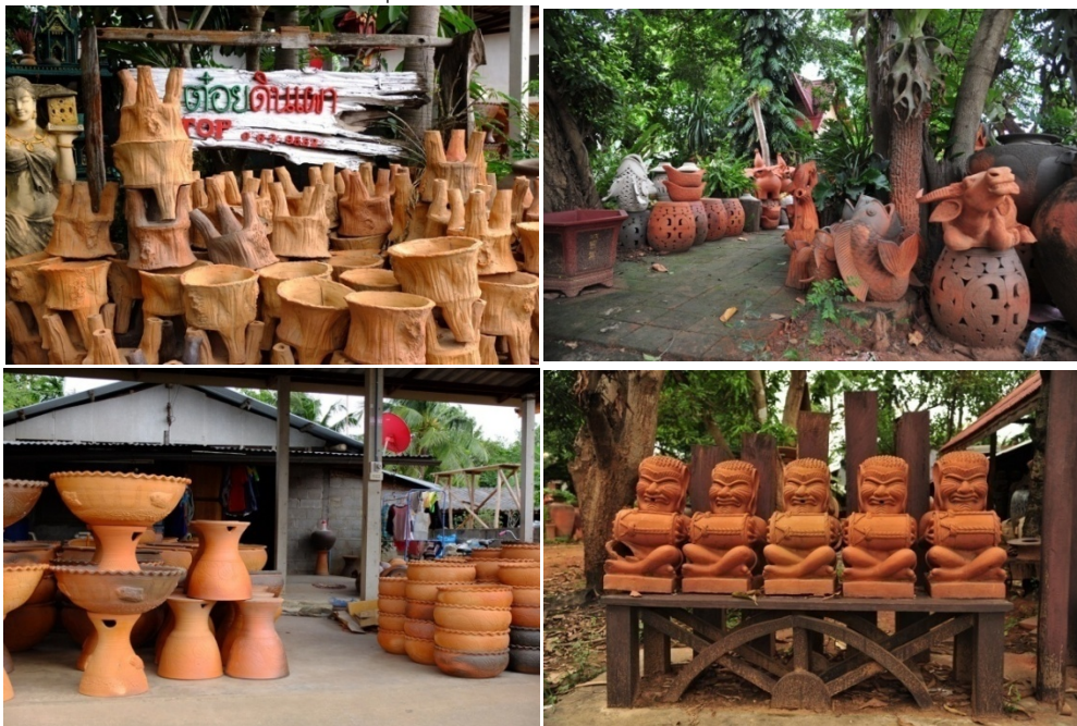
ภาพประกอบ 2 เครื่องปั้นดินเผาด้านเกวียน แบบไม่เน้นการประดับสีสังการตกแต่ง

การผลิตเครื่องปั้นดินเผาด้านเกวียนจะปรับปรุงไปตามยุคสมัยที่เปลี่ยนแปลง ปรับสภาพไปตามความต้องการ ของผู้บริโภคส่วนใหญ่ ที่จากเดิมจะมีเครื่องปั้นดินเผาเพื่อการใช้สอยในชีวิตประจำวัน เปลี่ยนไปเป็นเพื่อประโยชน์ด้าน อื่นๆ เนื่องด้วยเหตุนี้เองทำให้เครื่องปั้นดินเผาด้านเกวียนในยุคแรกๆ จะนิยมปั้นเป็นเครื่องใช้ที่จำเป็นในครัวเรือน เช่น หม้อน้ำ โอ่ง ครก ซามใส่อาหาร ต่อมาจึงได้พัฒนามาเป็น กระถาง ไท และอ่างน้ำ เป็นต้น พัฒนาตัดแปลงเรื่อยมาจนเป็น เครื่องประดับตกแต่งบ้านในสมัยปัจจุบัน